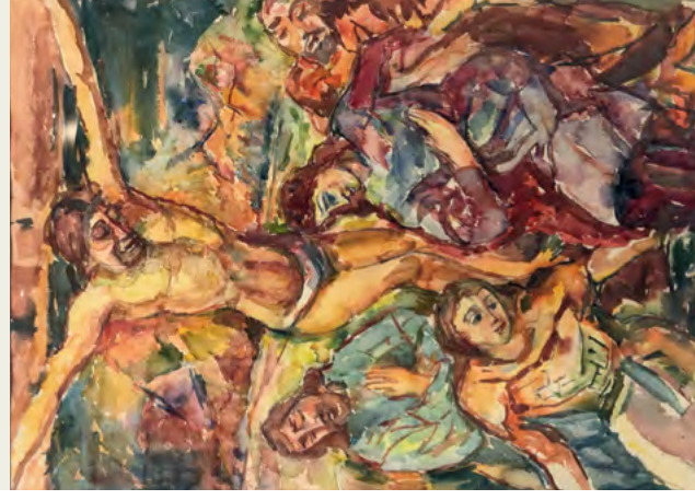
Crucifixion de Lutz Binaepfel : l'œuvre et un détail.