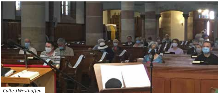
Culte à Westhoffen.