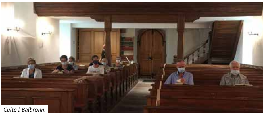
Culte à Balbronn.

Après un long temps d'arrêt, les cultes ont pu reprendre dans nos deux paroisses.